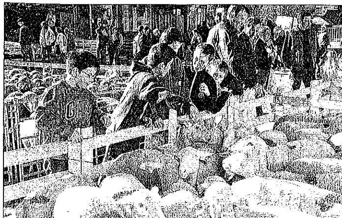
Les éleveurs haut-alpins jouent la carte de la qualité en proposant des produits à haute valeur ajoutée.

mes mal partis..." Les Européens du Nord n'ont pas, en effet, pour habitude de se préoccuper de l'agriculture de montagne. Pourtant, que deviendrait la montagne sans les agriculteurs ? "Nous espérons que nos gouvernants y penseront au moment de discuter la loi" conclut Laurent Alberti. Maurice FORTOUL